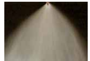
BOUILLIE + HELIOSOL®

HELIOSOL® FAVORISE LA COUVERTURE ET L'ÉTALEMENT TAUX DE COUVERTURE +60 %