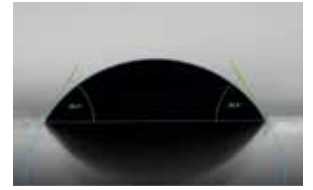
EAU + HELIOSOL® : 58,6°

LA FORCE ADHÉSIVE D'HELIOSOL® PERMET UNE ACCROCHE INSTANTANÉE DE LA BOUILLIE AU MOMENT DE L'IMPACT SUR LA CIBLE